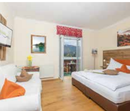
„CLASSIC“ 20m 2