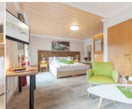
„KOMFORT“ 25m 2