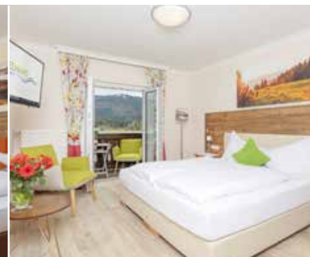
„CLASSIC“ 20m 2