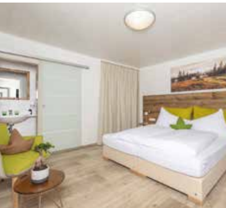
APARTEMENT 58m 2